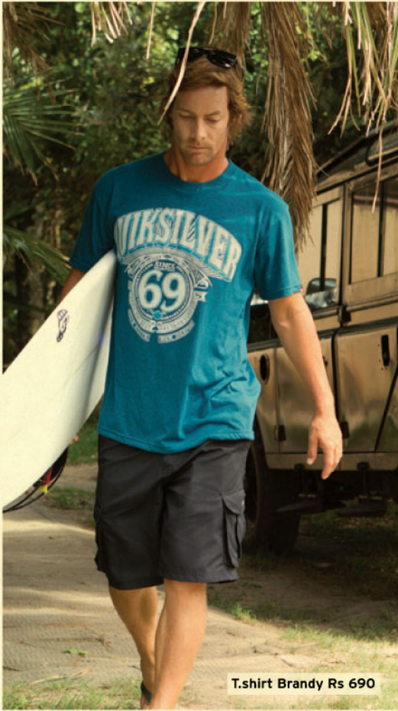
T-shirt Brandy Rs 690