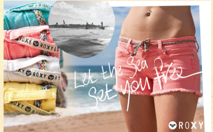
Ladies Walkshort Someday Lov'en2 Neon Coral Rs 1890