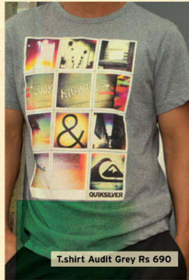
T-shirt Audit Grey Rs 690