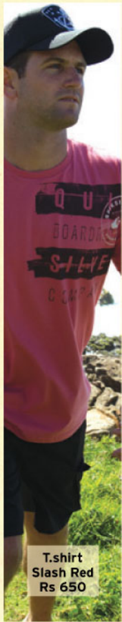
T-shirt Slash Red Rs 650