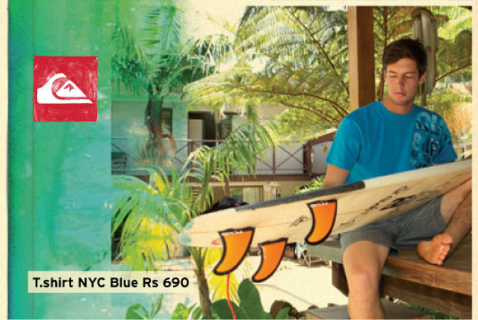
T-shirt NYC Blue Rs 690